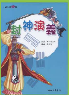
封神演義 原著/明·陸西星 編寫/姜子安 出版/三民書局

算術方法是：由已知的數據，透過四則運算，逐步計算，以求得答案。但是，每一步都要知道為何而算，以及算出的數所代表的意義。 代數方法是：由目標切入，假設答案已經得到，就是x與y，然後根據線索用方程式把它們捕捉住(這是分析法)，再根據數系的運算律，把x與y求出來(這是綜合法)。因此，代數是分析法與綜合法的展現，也是一種結構性、系統性的抽象解題方法，甚具威力，並且擁有向上發展的無窮潛力。今日代數學的語言已經成為現代數學與科學的基石。 從算術發展到代數是歷史的自然道路；反過來，從代數回頭看算術卻是更上一層樓的洞察本質。本書也特別著重數學史與人文背景的鋪陳，一切概念、方法與理論都是人類在特定時空背景下所創造出來的。這些構成了本書的主題。