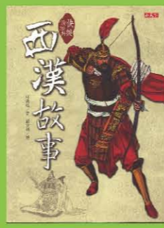
西漢故事 春秋故事/戰國故事/西漢故事/東漢故事/三國故事 作者/林漢達(春秋-三國)·雪崗(三國) 繪者/劉安利

「快樂讀經典」特別從「春秋」、「史記」、「漢書」、「後漢書」、「三國志」等典籍中取材具代表性的人物、事跡，寫成此系列五冊書。從周朝東遷一直說到晉朝統一全國為止，按照時代順序書寫，既重故事趣味，也注重歷史發展進程，每冊均搭配十~二十幅插圖，包括服飾、器具、建築等均著據翔實，讓讀者得以按圖索驥，對歷史現場有更進一步的了解與認識；也可以讓孩子無障礙的嚙嚙在東周至三國這段歷史現場，為國中歷史課預作準備。 這一階段的歷史時期，風起雲湧、人事更迭，幾乎是中國成語起源的寶藏，因此，不僅可以將本書當作知識書，也可以當作文學書輕鬆閱讀。而懂得成語的來龍去脈，可以在無形中幫孩子打下國學根基，還可以讓他們靈活運用，轉化為寫作的養分，並強化語文的敘述能力。