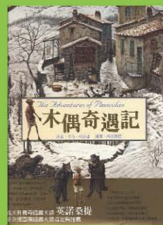
木偶奇遇記 The Adventures of Pinocchio 作者/卡洛·科洛迪 繪畫/英諾森提

每讀完一本書，並寫下三百字以上讀書報告(題目自訂)，即可獲得執行長精選書籍乙冊以及貼紙五張。