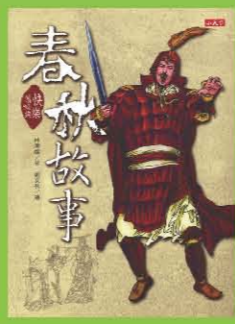
春秋故事 東漢故事 三國故事

「快樂讀經典」特別從「春秋」、「史記」、「漢書」、「後漢書」、「三國志」等典籍中取材具代表性的人物、事跡，寫成此系列五冊書。從周朝東遷一直說到晉朝統一全國為止，按照時代順序書寫，既重故事趣味，也注重歷史發展進程，每冊均搭配十~二十幅插圖，包括服飾、器具、建築等均著據翔實，讓讀者得以按圖索驥，對歷史現場有更進一步的了解與認識；也可以讓孩子無障礙的嚙嚙在東周至三國這段歷史現場，為國中歷史課預作準備。 這一階段的歷史時期，風起雲湧、人事更迭，幾乎是中國成語起源的寶藏，因此，不僅可以將本書當作知識書，也可以當作文學書輕鬆閱讀。而懂得成語的來龍去脈，可以在無形中幫孩子打下國學根基，還可以讓他們靈活運用，轉化為寫作的養分，並強化語文的敘述能力。