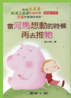
當河馬想動的時候再去推牠 作者/張文亮 出版/國語日報

人類為什麼要以穀類的種子作為主要食物?半夜為什麼馬桶裡的水會晃動?誰想替水漱口紅?大地的奶嘴公式是什麼理論?傑出的科學家，其實是從詢問一些非常基本的問題裡，點燃了真理的火把!本書介紹了五十三位科學家的故事，書中的史料來源，大多是來自「水文學的歷史」、「古典與中古世紀工程史」、「地質科學的起源與發展」、「土壤物理由早期到二十世紀的發展」，與一些老舊的研究期刊。七八十年前的研究期刊，經常會記載該領域有傑出一種新的科學家。「歷史」是一種懷舊，歷史是用一種深遠的角度，去看每一件新的事情。當歷史與科學相遇的時候，會發生出一種新的亮光，會講出新的曲調，迴盪在那古老的迴廊裡。