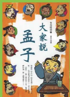
大家說孟子 作者/岑澎維 繪圖/吳孟芸 出版/國語日報

人類為什麼要以穀類的種子作為主要食物?半夜為什麼馬桶裡的水會晃動?誰想替水漱口紅?大地的奶嘴公式是什麼理論?傑出的科學家，其實是從詢問一些非常基本的問題裡，點燃了真理的火把!本書介紹了五十三位科學家的故事，書中的史料來源，大多是來自「水文學的歷史」、「古典與中古世紀工程史」、「地質科學的起源與發展」、「土壤物理由早期到二十世紀的發展」，與一些老舊的研究期刊。七八十年前的研究期刊，經常會記載該領域有傑出一種新的科學家。「歷史」是一種懷舊，歷史是用一種深遠的角度，去看每一件新的事情。當歷史與科學相遇的時候，會發生出一種新的亮光，會講出新的曲調，迴盪在那古老的迴廊裡。