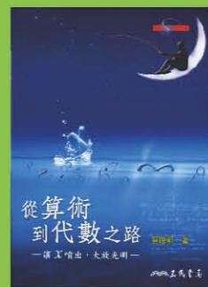
從算術到代數之路 作者/蔡聰明 出版/三民書局

從算術發展到代數是歷史的自然道路；反過來，從代數回頭看算術卻是更上一層樓的洞察本質。本書也特別著重數學史與人文背景的鋪陳，一切概念、方法與理論都是人類在特定時空背景下所創造出來的。這些構成了本書的主題。