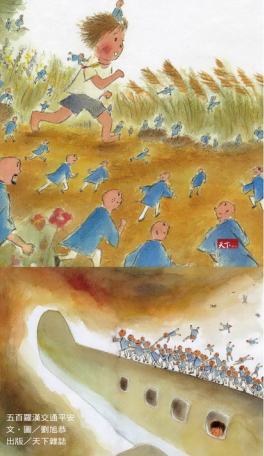
五百羅漢交通平安 文／鄭怡娟 出版／天下雜誌