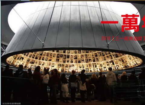
紀念與名號博物館

戴奧真尼斯在有一大木桶，所有有的財產，包括一個木桶、一件斗篷、一隻鞋子、一個麵包袋。