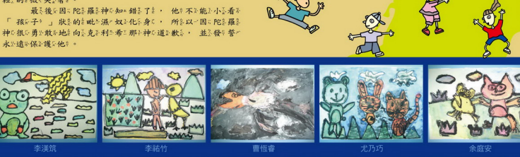
李漢瑛 李結玉 曹世會 尤乃巧 余庭安 周亭儀 莊大寬 陳雷 馬國倫 陳恩恩