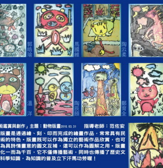
美術區畫賞主題：動物版畫 08.03.31 指導老師：范佐安 版畫是透過蝕、刻、印或刷的繪畫作品，常常具有民間與商業的性質。版畫既可以用於商業用途，也可以作為藝術品收藏。版畫可以作為裝飾之用。版畫可以化一為千百，它不僅僅傳播藝術，同時也傳播了歷史文化、科學知識，為知識的普及立下汗馬功勞！