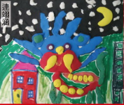
「美術展覽創作」主題：年獸來了 指導老師：徐家麟