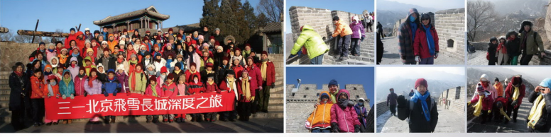
三一北京飛雪長城深度之旅