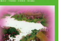
4. 陶淵明是採取一種動態的觀點，一路走一路描述景致，由近而遠。