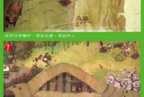
7. 山有小口，彷彿若有光，吸引著人進入。