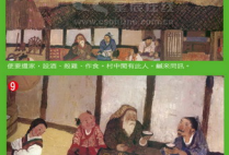
9. 山有小口，彷彿若有光，吸引著人進入。