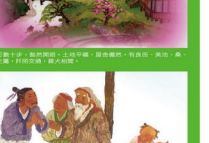
6. 漁人甚異之，復前行，欲窮其林。林盡水源，便在那裡得一山，山有小口，彷彿若有光。