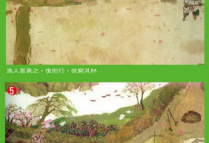
5. 緣溪行，忘路之遠近。忽逢桃花林，夾岸數百步，中無雜樹，芳草鮮美，落英繽紛。