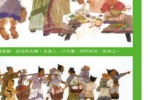
8. 漁人甚異之，復前行，欲窮其林。林盡水源，便在那裡得一山，山有小口，彷彿若有光。