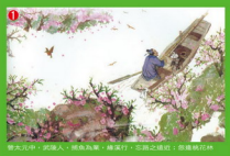
1. 漁人持竿，漁舟輕移，漁人持竿，漁舟輕移，漁人持竿，漁舟輕移。