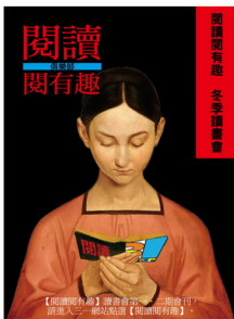
【閱讀有禮】讀書會「史博館——燃燒的靈魂：梵谷特展」導讀