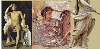
特洛伊的赫克托 亞歷山大大帝 凱撒大帝