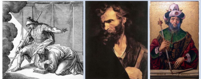
約書亞 馬加伯的猶太 大衛王