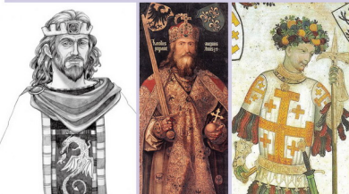
亞瑟王 查理曼大帝 布羅的歐佛雷

1066-1100。1099年第一位在耶路撒冷稱王的拉丁民族國王，自稱「聖墓守護者」，拒絕稱國王。(詳西洋人文經典第40講)「聖九位勇士第一次出現在1312年」當時流行的織毯，以及後來出現的紙牌遊戲，都可以看出他們的流行。